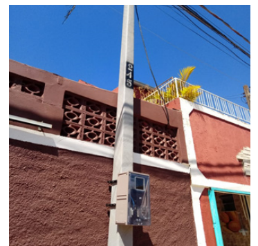
Postes instalados em parceria com a CPFL