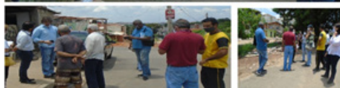
Reunião com os membros da CAO