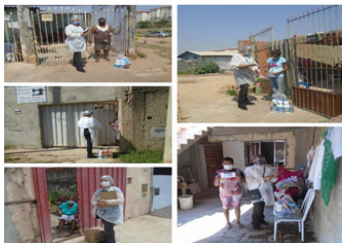
Entrega dos kits sanitários

e máscaras de proteção individual. Essas ações foram de extrema relevância, uma vez que muitas pessoas perderam o trabalho e muitas não estavam cumprindo o distanciamento social, necessários para a prevenção contra o novo Coronavírus.