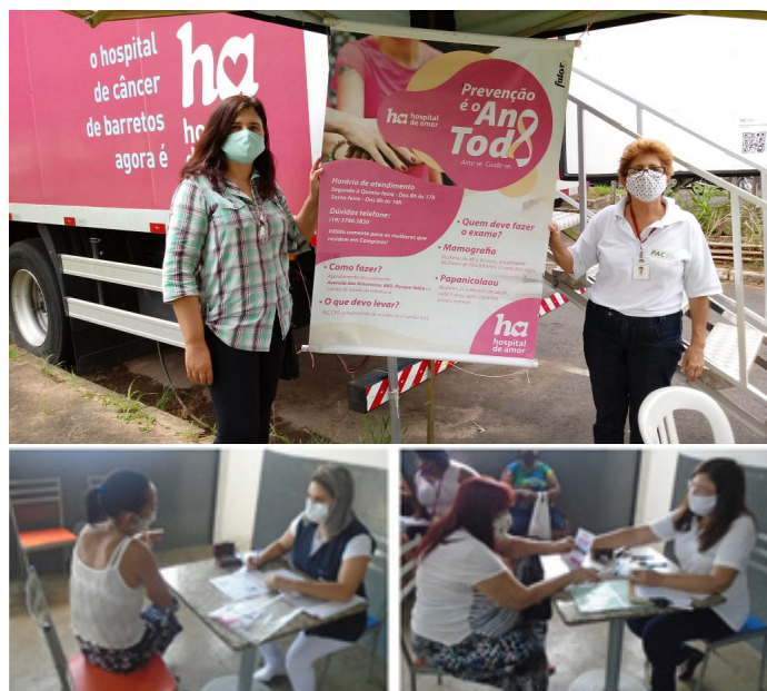
Encaminhamento para realização de exames de papanicolau e mamografia

telefone: (19) 99449 0035. A assistente social fará os encaminhamentos para os agendamentos dos exames.