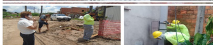
Retirada e recolocação de postes de energia elétrica