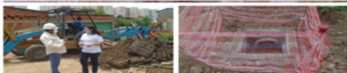
Obras de drenagem de águas pluviais