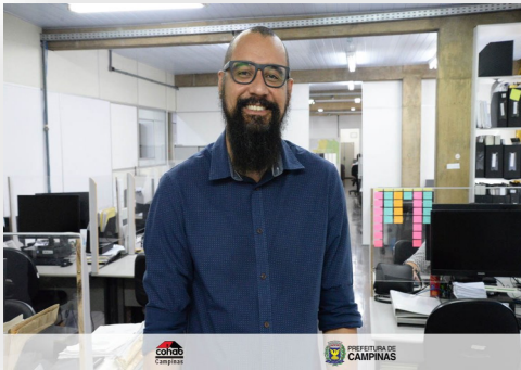
Diretor Técnico Regularização Fundiária COHAB

Demonstrando que a Lei da Reurb traz em seu escopo medidas que não terminam na legitimação do reconhecimento do proprietário do lote, mas sim estende-se à medidas sociais ; meio ambiente, econômicas de acessibilidade e mobilidade para idosos e deficientes, que viabiliza a melhoria na qualidade de vida para os que se encontram em situação de vulnerabilidade. O Núcleo Residencial São Charbel foi escolhido para aplicação do projeto piloto REURB Acessível-Charbel, numa construção conjunta da comunidade, Cohab e LABINUR-Unicamp.