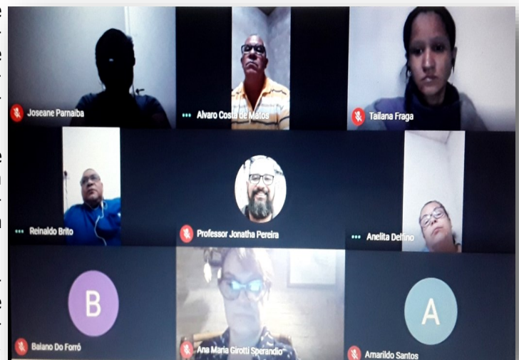
Reunião com Líderes Jd São Charbel / COHAB Campinas

Foi em consenso a escolha de uma casa habitada por pessoa idosa ou deficiente, para que fosse possível avaliar a vivência e as dificuldades de acessibilidade e mobilidade, como piloto neste projeto, no planejamento das visitas técnicas virtuais.