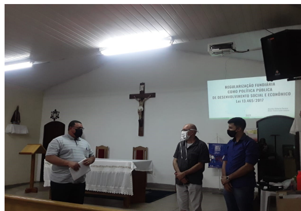
Local: Comunidade Maria Mãe dos Migrantes