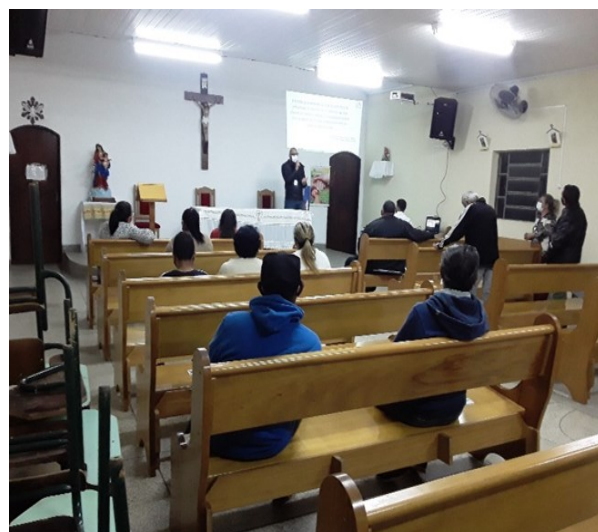
Entrega dos convites aos moradores.

Devido a pandemia do Covid 19 houve a necessidade de dividir o evento de abertura em dois momentos, para evitar aglomeração. O segundo momento foi aconteceu no dia 18 de agosto, contemplando os demais moradores.